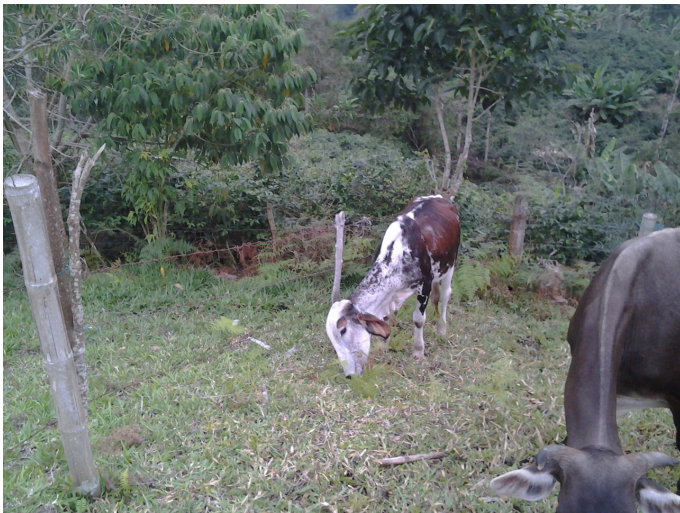
Figura 1. Bovino en una de las fincas muestreadas consumiendo un helecho joven.

Las muestras se colectaron en cada uno de los cuatro estados fenológicos del helecho (I, II, III y IV, Figura 2) provenientes de los dos municipios muestreados (n = 8) de acuerdo con lo reportado por Alonso-Amelot (1999) 3 . Las muestras se obtuvieron de dos granjas distintas de cada municipio, se agruparon de acuerdo a su estado fenológico y se mantuvieron refrigeradas a 4 °C hasta su secado a 45 °C durante 5 días. Posteriormente se trituraron en trozos menores a 2 mm para su posterior envío al laboratorio analítico.