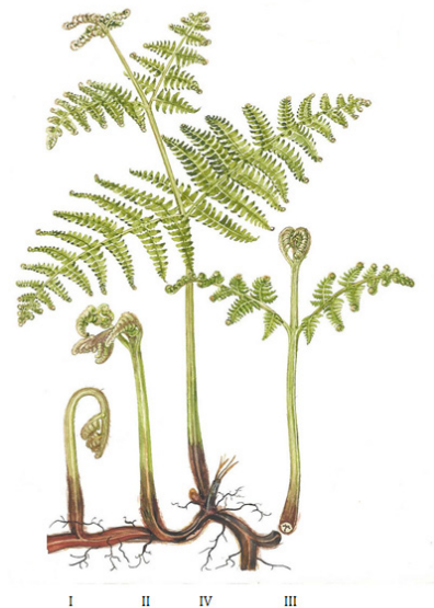
Figura 2. Estados fenológicos de Pteridium aquilinum (I, II, III y IV). Modificada de Øllgaard & Tind(1993) 11 con autorización de los autores.