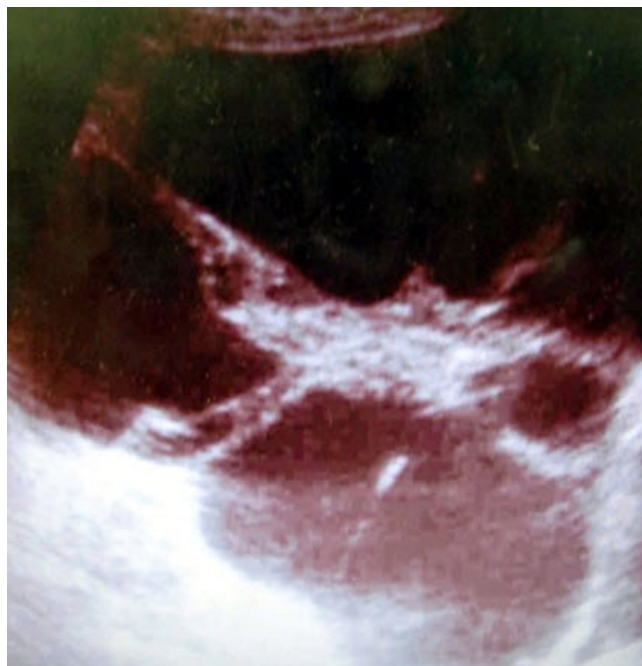
Figura 1. Imagen ecográfica del abdomen en la cual se observa la tumoración quística

Los linfangiomas quísticos son tumores benignos, de crecimiento lento, derivados del tejido linfático y ocurren principalmente en niños en cuello y axila.