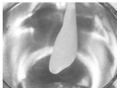
Figura 2. Gel de PRP

Se retira la capa superficial y se almacena el PRP en un recipiente de vidrio para crear el gel (figura 2).