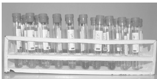
Figura 1. Tubos sin anticoagulante con PRP

Para la obtención del PRP se extrae del paciente de 20cc a 50cc de sangre total dependiendo del volumen del defecto, teniendo en cuenta, que al final del proceso de cada tubo de 5cc se obtienen 0.5 ml de PRP aproximadamente (figura 1).